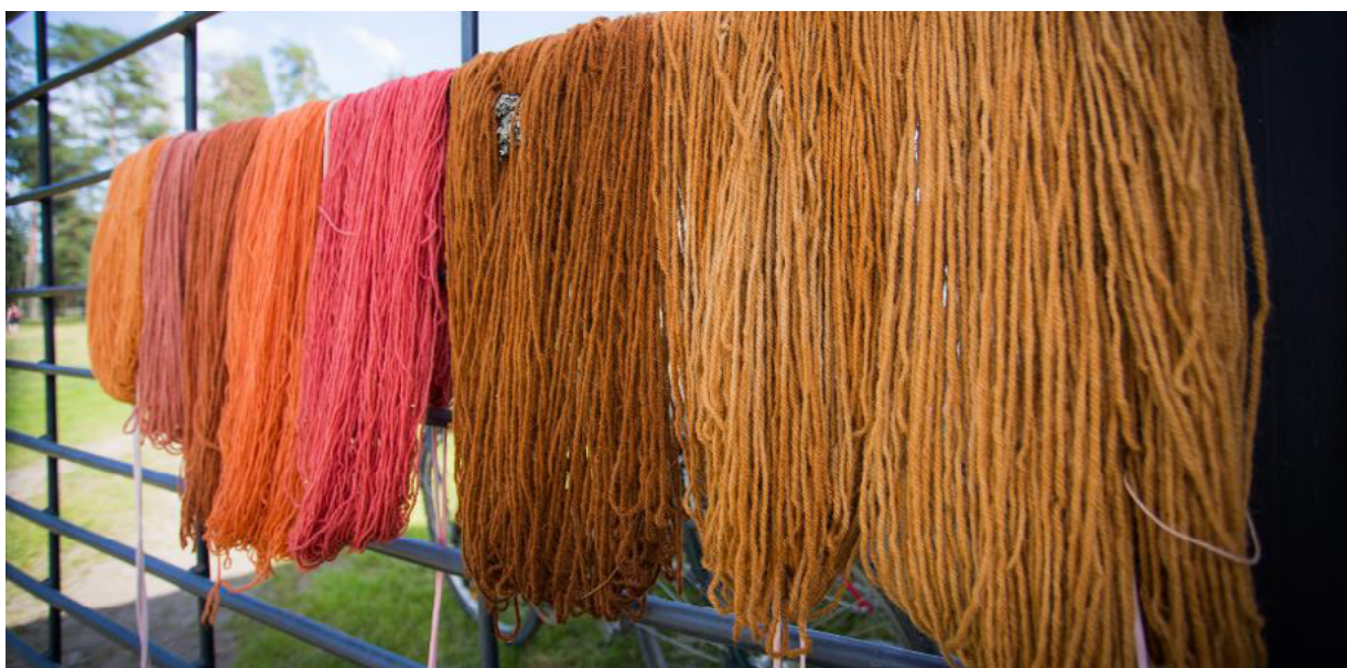
Fig 4 - Lã de várias cores.

Na loja desta exploração podem ser adquiridos produtos de qualidade que são difíceis de encontrar no comércio comum. Existe carne de cordeiro, salsichas, peles de ovelha, lã para tricot e mantas de lã feitas à mão.