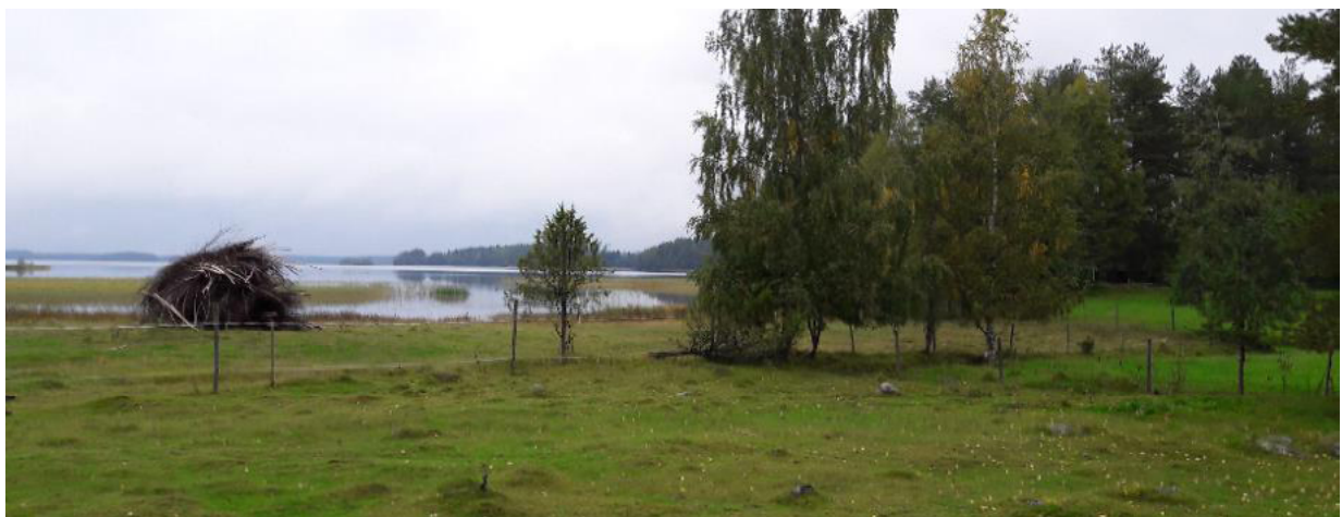
Fig 2. Sistema silvopastoril junto ao Lago