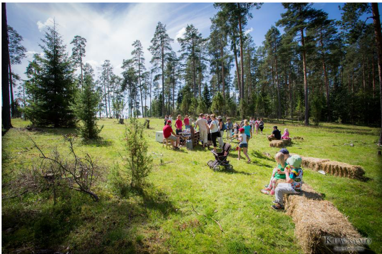
Fig 6 - Dia aberto ao público em Putkisalo.