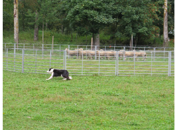
Fig 1 - Inka pronta a trabalhar (acima) e Inka a trabalhar (abaixo)