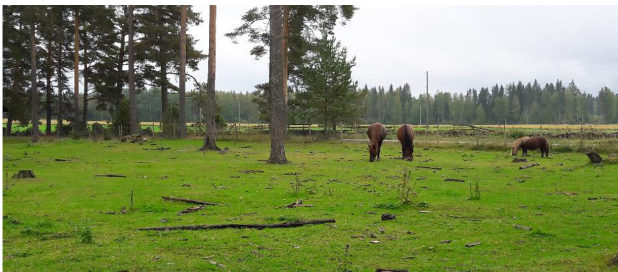
Fig 3 - Cavalos no sistema silvopastoril com Pinheiro silvestre

A exploração também gere habitats rurais tradicionais incluindo 20 ha de sistemas silvopastoris, alguns dos quais com mais de 200 anos. Estes sistemas encontram-se entre os habitats de maior biodiversidade do norte da Europa. Desde que adequadamente geridas, as áreas submetidas a pastoreio têm em geral maior biodiversidade que as áreas sem pastoreio. O que significa que a gestão é uma parte fundamental.