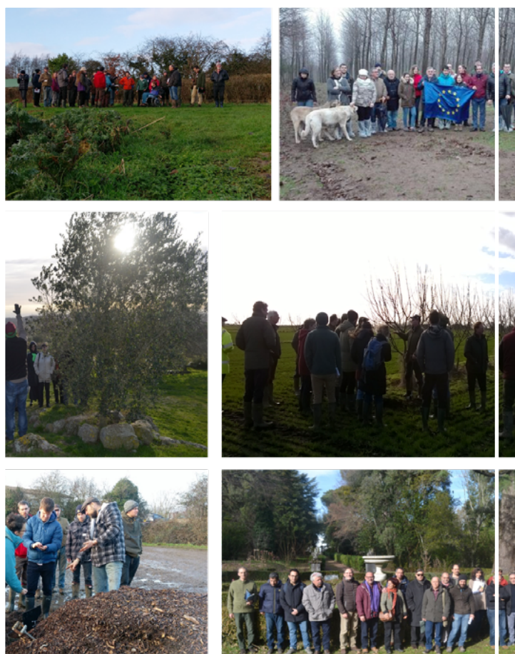
Wizyty w gospodarstwach podczas II. serii spotkań Sieci RAIN

Podczas drugiej serii spotkań RAIN przedyskutowano już pierwsze zidentyfikowane trudności. Inspirujące i cenne merytorycznie wykłady zostały wygłoszone przez partnerów projektu, badaczy i praktyków w każdym regionie. Zakres poruszanych tematów sięgał od szeroko rozumianego agroleśnictwa (ustawodawstwo, prowadzone badania, możliwości rynkowe kreowane przez agroleśnictwo...) po bardziej konkretne tematy, jak uprawa i sprzedaż orzecha włoskiego. W niektórych regionach uczestnicy spotkań brali udział w wizytach w gospodarstwach stosujących systemy rolno-leśne, czy nawet mogli zaobserwować przykłady dobrych praktyk np. przycinanie drzew oliwnych. Różne rodzaje systemów rolno-leśnych prezentowane były przez regionalne Sieci RAIN, począwszy od systemu łączącego produkcję drewna z orzechem włoskim czy sad wiśniowy w połączeniu z hodowlą owiec, po kombinacje ekologicznych upraw warzyw w sadzie jabłoni i roślin pastewnych z hodowlą inwentarza.