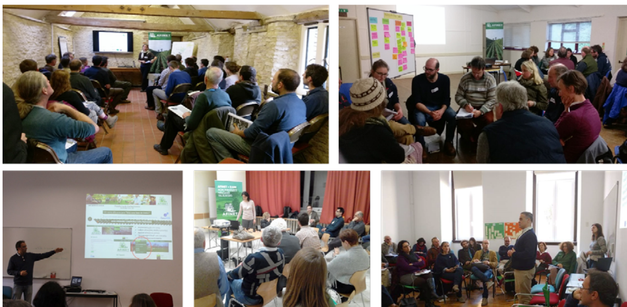
Prezentacje i warsztaty podczas II serii spotkań Sieci RAIN