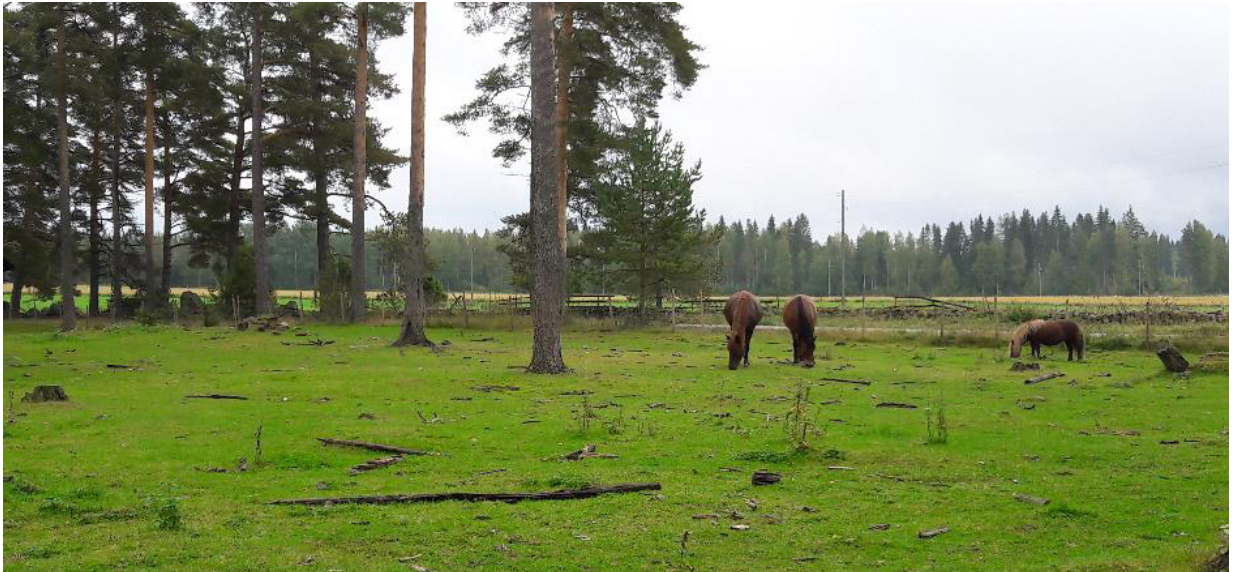
Lovak legelnek egy erdei fenyővel tarkított fás legelőn

A farm hagyományos vidéki gazdálkodást is folytat 20 hektár fás legelővel, amiből néhány már több mint 200 éve létesült. A hagyományos fás legelők a legnagyobb biológiai sokféleséggel bíró élőhelyek között vannak Észak-Európában. A megfelelő kezelés mellett a legeltetett területek általában magasabb biodiverzitással rendelkeznek, mint a legeltetés nélküli területek, ezért nagyon fontos fenntartani legelőgazdálkodást. A fás legelőn, ami hozzátartozik a Putkisalo kartanhoz juhok, finn marhák és lovak legelnek. A bányák januártól áprilisig jönnek a világra és május közepe felé az anyjukkal együtt kezdik látogatni a legelőket, ahol egész nyáron legelnek. Néhány bányák augusztusban születik. Két finn ló (Suomenhevonen), Jesella és Palome 5 hektárnyi fás legelőt használ. A farm saját lovain kívül más lovak is legelnek ezeken a legelőkön. Továbbá, Putkisalo kartanonak van egy egyezsége a Finn Erdő és Park Szolgálattal, miszerint bérbead juhokat a legeltetési területek kezelésére a közeli Haukivesi-tónál található Linnansaari Nemzeti Parkba. A juhokat hajóval viszik a szigetre.