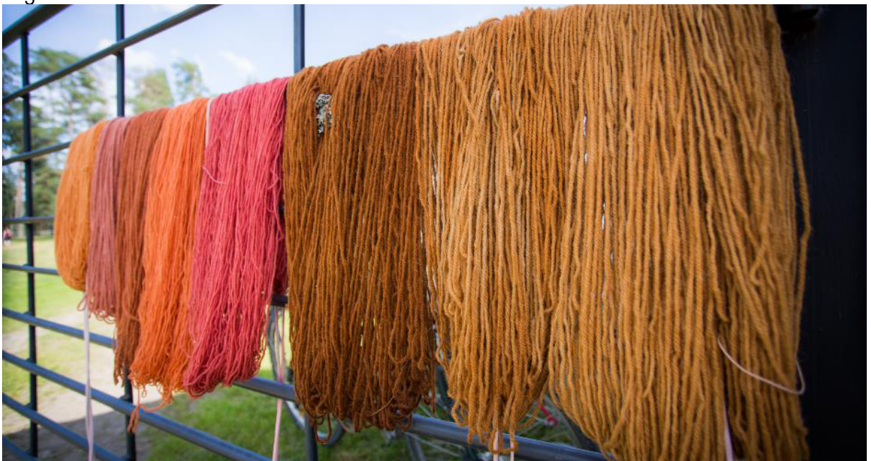
Gyapjú különböző színekben.

A farm hagyományos vidéki gazdálkodást is folytat 20 hektár fás legelővel, amiből néhány már több mint 200 éve létesült. A hagyományos fás legelők a legnagyobb biológiai sokféleséggel bíró élőhelyek között vannak Észak-Európában. A megfelelő kezelés mellett a legeltetett területek általában magasabb biodiverzitással rendelkeznek, mint a legeltetés nélküli területek, ezért nagyon fontos fenntartani legelőgazdálkodást. A fás legelőn, ami hozzátartozik a Putkisalo kartanhoz juhok, finn marhák és lovak legelnek. A bányák januártól áprilisig jönnek a világra és május közepe felé az anyjukkal együtt kezdik látogatni a legelőket, ahol egész nyáron legelnek. Néhány bányák augusztusban születik. Két finn ló (Suomenhevonen), Jesella és Palome 5 hektárnyi fás legelőt használ. A farm saját lovain kívül más lovak is legelnek ezeken a legelőkön. Továbbá, Putkisalo kartanonak van egy egyezsége a Finn Erdő és Park Szolgálattal, miszerint bérbead juhokat a legeltetési területek kezelésére a közeli Haukivesi-tónál található Linnansaari Nemzeti Parkba. A juhokat hajóval viszik a szigetre.