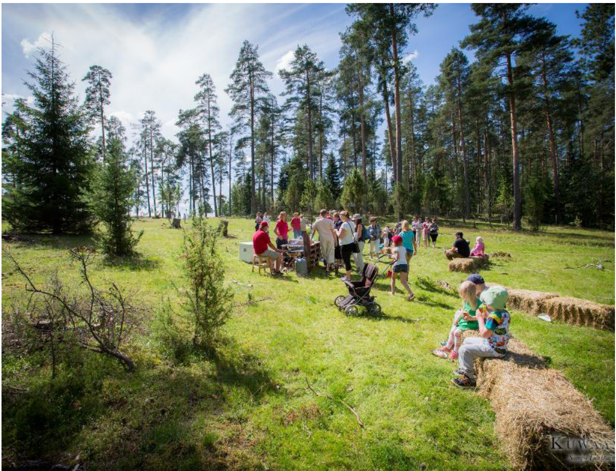
Nyílt nap Putkivalon.