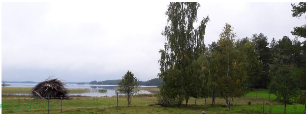
Fas legelő a tó mellett

collies) és juhászkutya kiképzést végez, amit kölyökkorban kezdenek. A legjobb a kiképzést minél korábban elkezdni annak érdekében, hogy elkerüljék a kutyák első évében véthető hibákat, ami visszaveti a kutya érdeklődését a terelés iránt. A kiképzés nem csak kutyáknak szól; a juhászoknak is ajánlott résztvenni ugyanazon a kiképzésen. A siker érdekében a kiképzési program tartalmazza a teljes oktató csomagot a kutyának és a gazdájának egyaránt. Sok országból hoztak ide juhászkutya-kat kiképzésre.