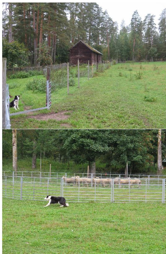
Inka készen áll a munkára és Inka munka közben

A juhászkutyák vidám társak és nagyszerű segítők a juhok terelésében, hatékonyan leeredukálják. Ők nagyszerűen leeredukálják a farm munkaigényét. A Putkivalo kartano tenyészt juhászkutyákat is (Border