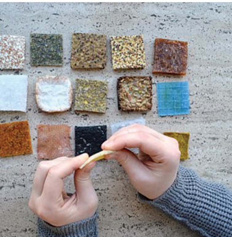
I residui del processo di trasformazione delle olive possono essere impiegati per la produzione di bio-materiali. Cecilia Cecchini