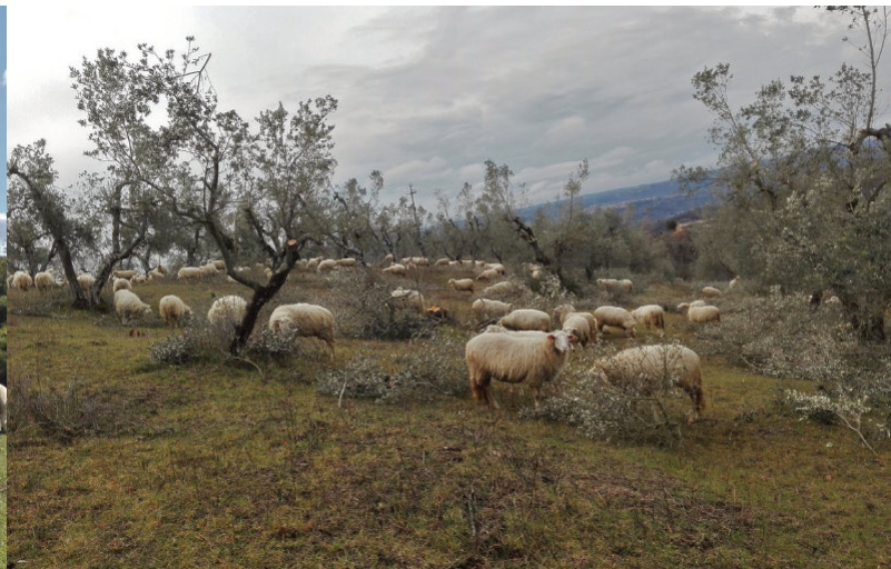
Alimentación de ovinos en residuos de poda de olivos. Claudia Consalvo