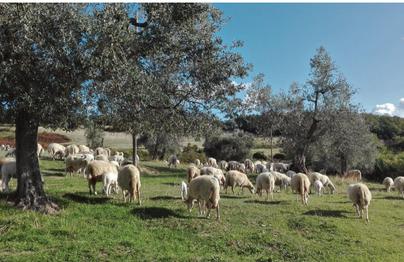
Ovejas en un campo de olivos tradicional en Orvieto, Italia. Claudia Consalvo

Alimentar a las ovejas con hojas de olivo tiene un efecto positivo en el perfil de ácidos grasos del queso y, por lo tanto, mejora la calidad de la nutrición humana. El pastoreo con hoja de olivo ofrece muchos beneficios: las ovejas reducen los costes de desbroce al controlar el crecimiento de pasto y retoños y aumentan el reciclaje de nitrógeno, mientras que las hojas de olivo proporcionan alimento de alta calidad al ganado ovino en invierno cuando se reduce la disponibilidad de pasto.